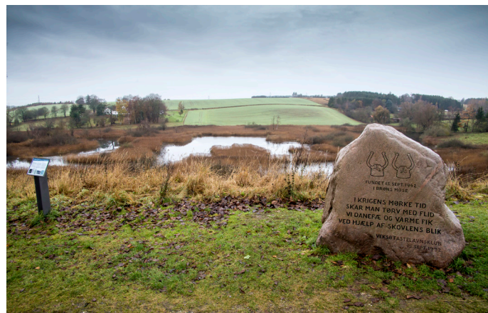
Udsigt udover Brønsmose med en sten til minde om fundet af Veksøhjemlene.

Brønsmose tæt ved Veksø er fundstedet for Veksøhjemlene, to hornede hjelme fra bronzealderen 1.000 – 800 f. Kr. nedlagt i en sø som offergave, placeret på en træbakke af asketræ.