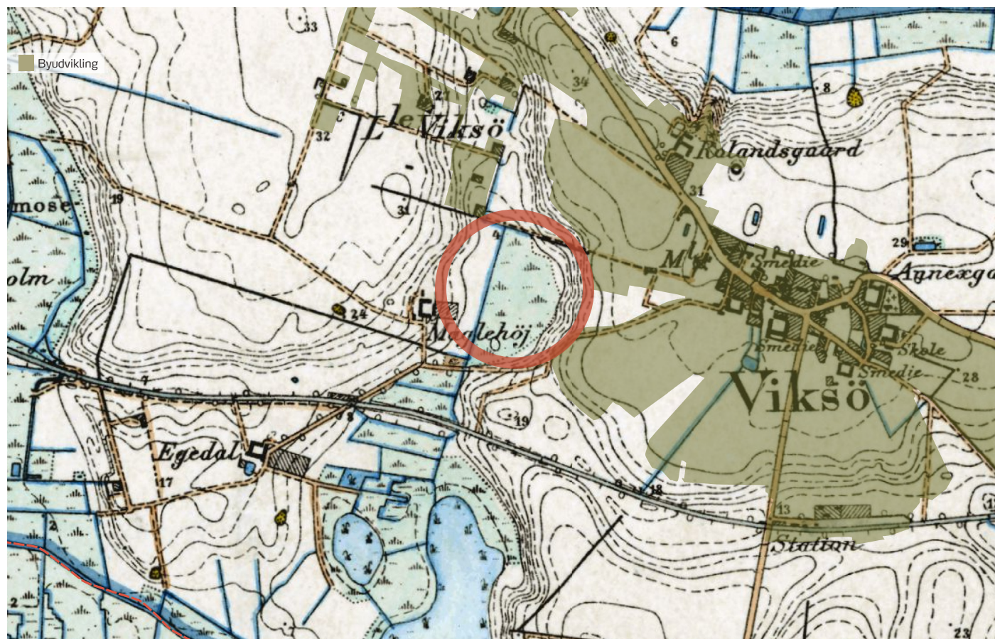
Historisk kort (1842-1899) med udpegnig af Brønsmose og byudviklingen i Veksø.

Selvom turistindustrien ofte afbilder vikinger med hornede hjelme, kendes de ikke fra vikingetiden, men kun fra bronzealderen to tusinde år tidligere.